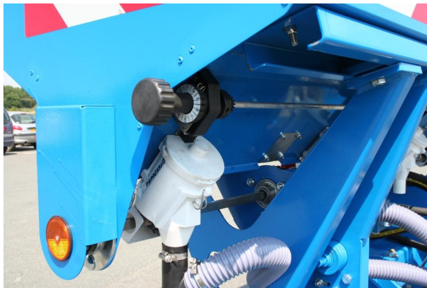
Központi adagolóelem állítás