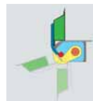
Lekerekített szélű, öntisztuló platólemez