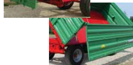
Oldalak többféle nyitási lehetőséggel