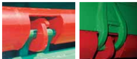
Biztonságos zárás erős záróvillával