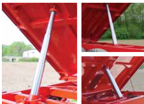
Az erős teleszkópos munkahenger biztosítja a felépítmény billentését