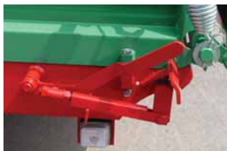
Az oldalak egyszerű kezelése központi nyitással