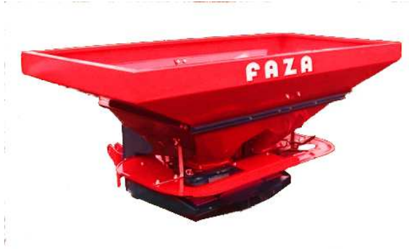
1000 literes FAZA DE LUX műtrágyaszóró

Közepes és nagyobb gazdaságokba, elsősorban szántóföldi talaj-erő utánpótlásra ajánljuk.