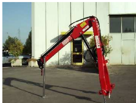
FAZA GPI-100 hidraulikus darukar Cikkszám: 154002201