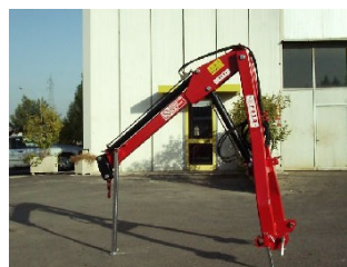
FAZA GPI-100 hidraulikus darukar