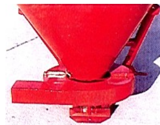
F/FS sorszóró adapter

Szőlő és gyümölcs ültetvényekbe ajánljuk.