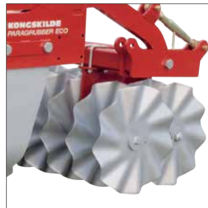
Kongskilde Paragrubber ECO 3000 vágótárcsával.