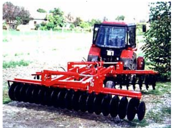
MW KVTB-4,3-H TÁRCSA