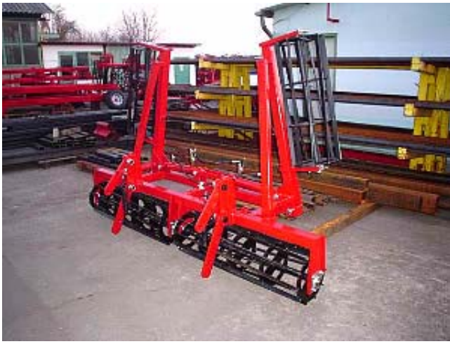
MW RT-4,3 RÖGTÖRŐ