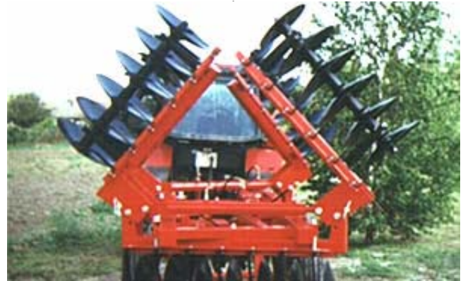
MW KVTB-4,3-H TÁRCSA