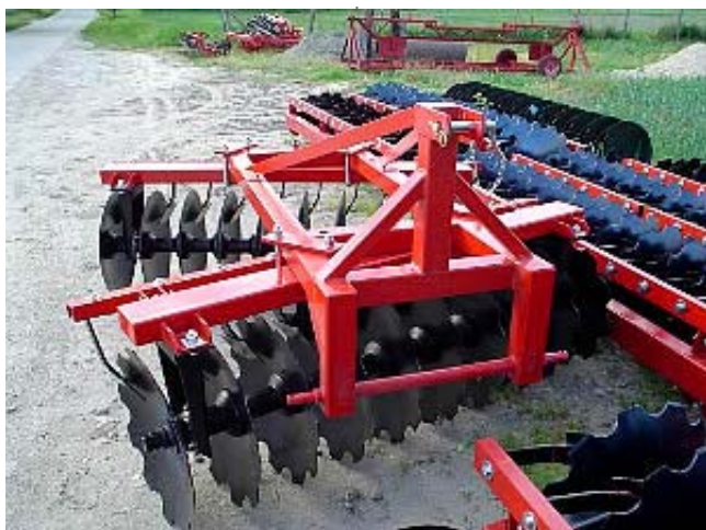
MW FTB-2,0 TÁRCSA