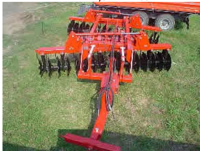
EGYEDI KIALAKÍTÁSÚ MW NVTB-3,4-H