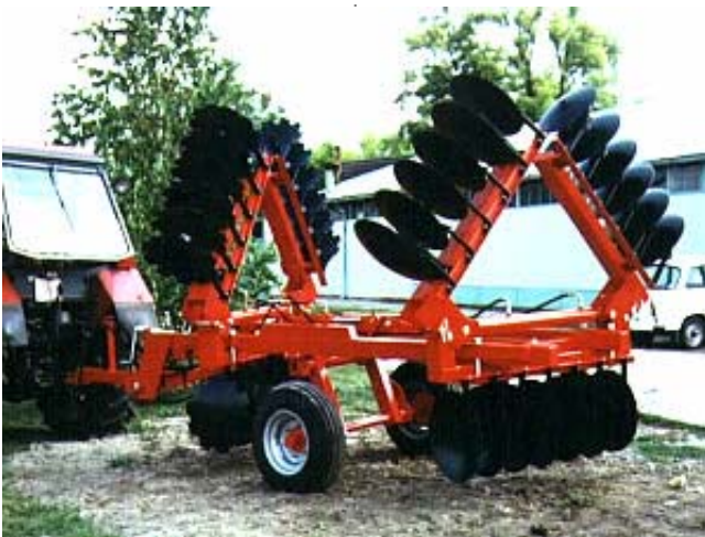
MW KVTB-4,3-H TÁRCSA