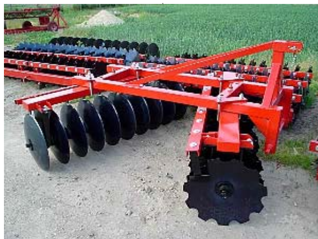
MW FTB-2,0 TÁRCSA