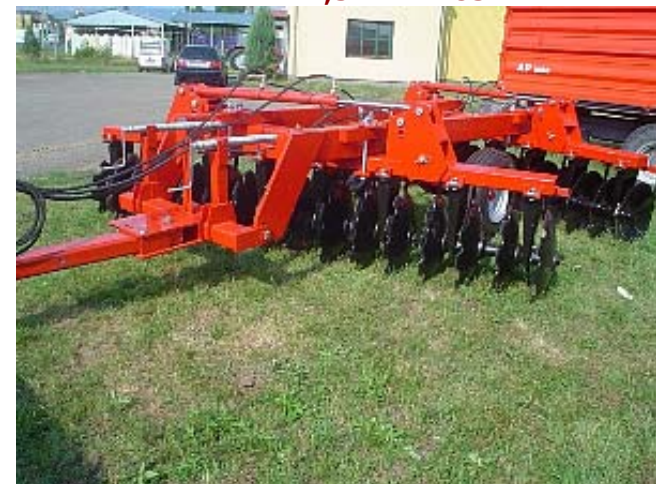
EGYEDI MW NVTB-3,4-H TÁRCSA