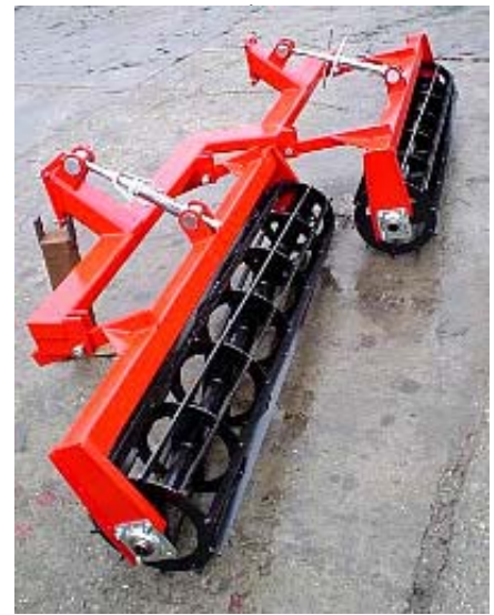
MW RT-3,2 RÖGTÖRŐ