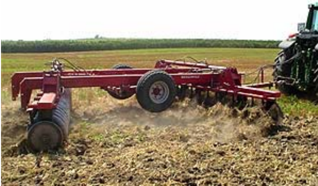
MW NVTB-4,6-H TÁRCSA