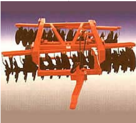
MW KVTB-3,2 TÁRCSA