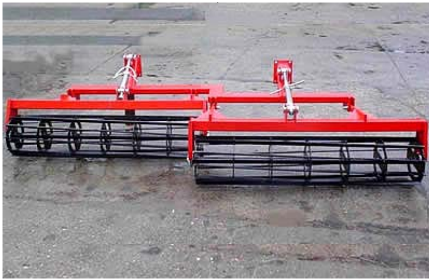
MW RT-3,2-es rögtörő MW KVTB-3,2-tárcsához