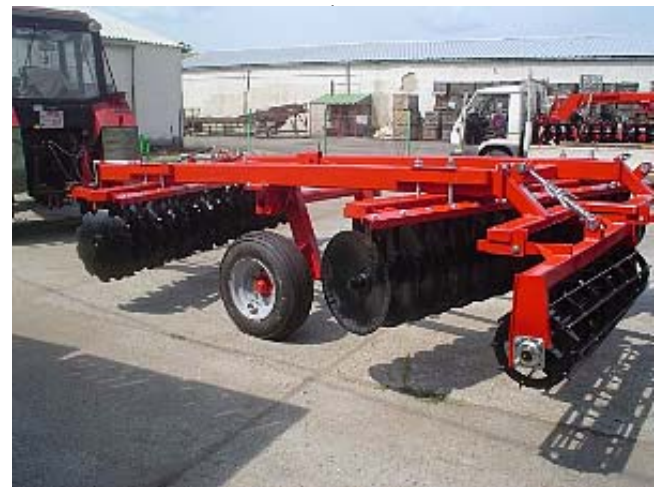
MW KVTB-3,2 TÁRCSA + rögtörő henger