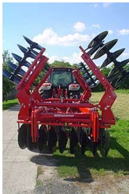
MW NVTB-4,6 H