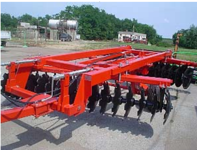
MW KVTB-3,2 TÁRCSA + rögtörő henger