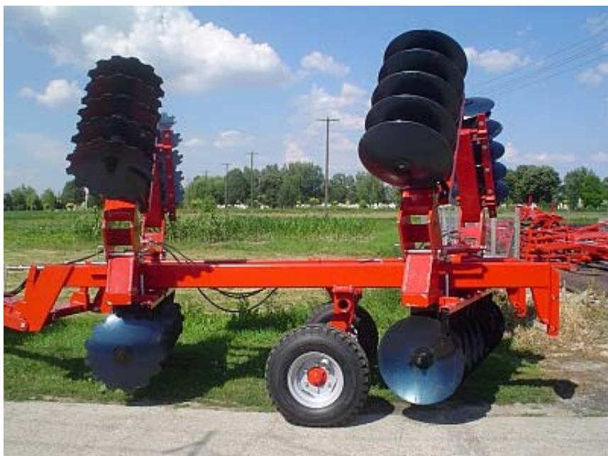
MW NVTB-4,6 H RÖGTÖRŐS VÁZZAL