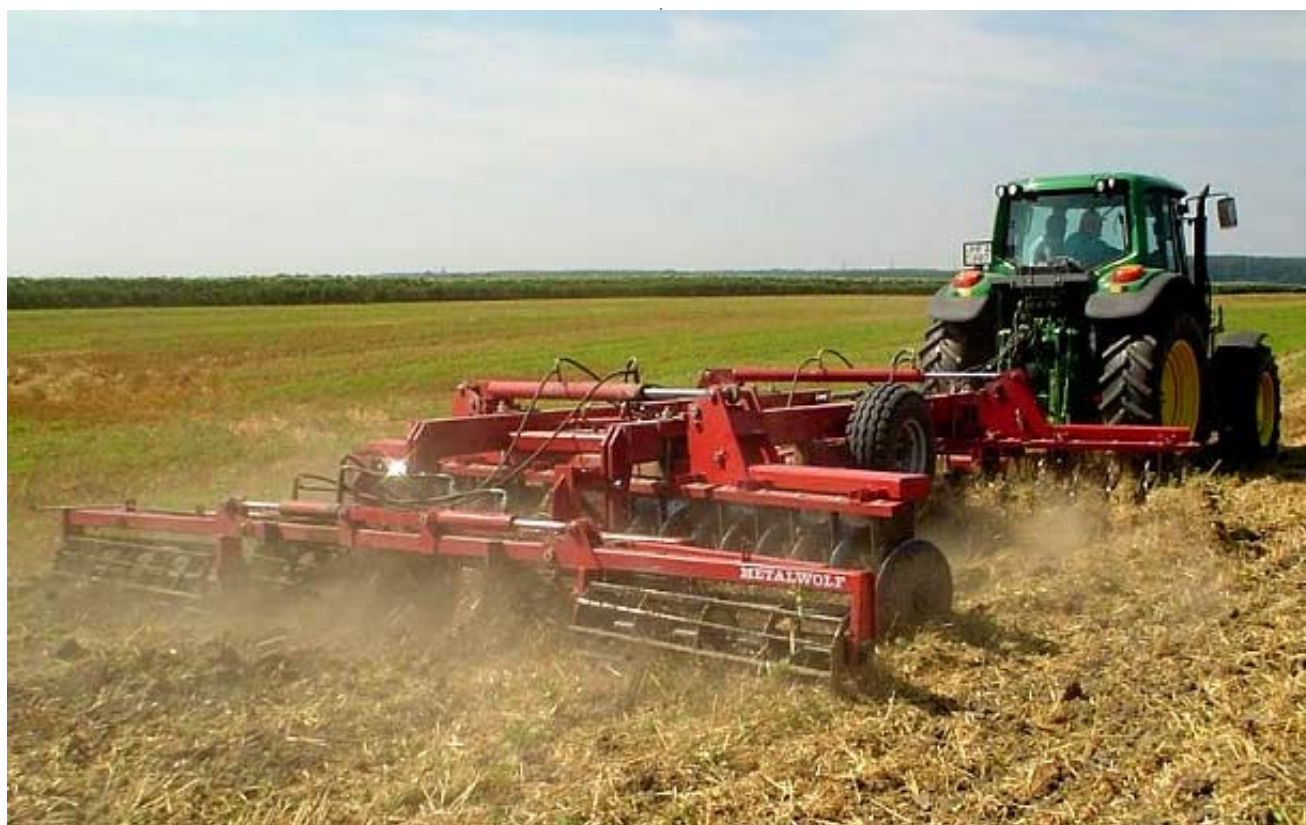
MW RT-4,3-as rögtörő MW KVTB-4,3 tárcsához