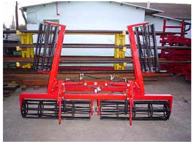
MW RT-4,3 RÖGTÖRŐ