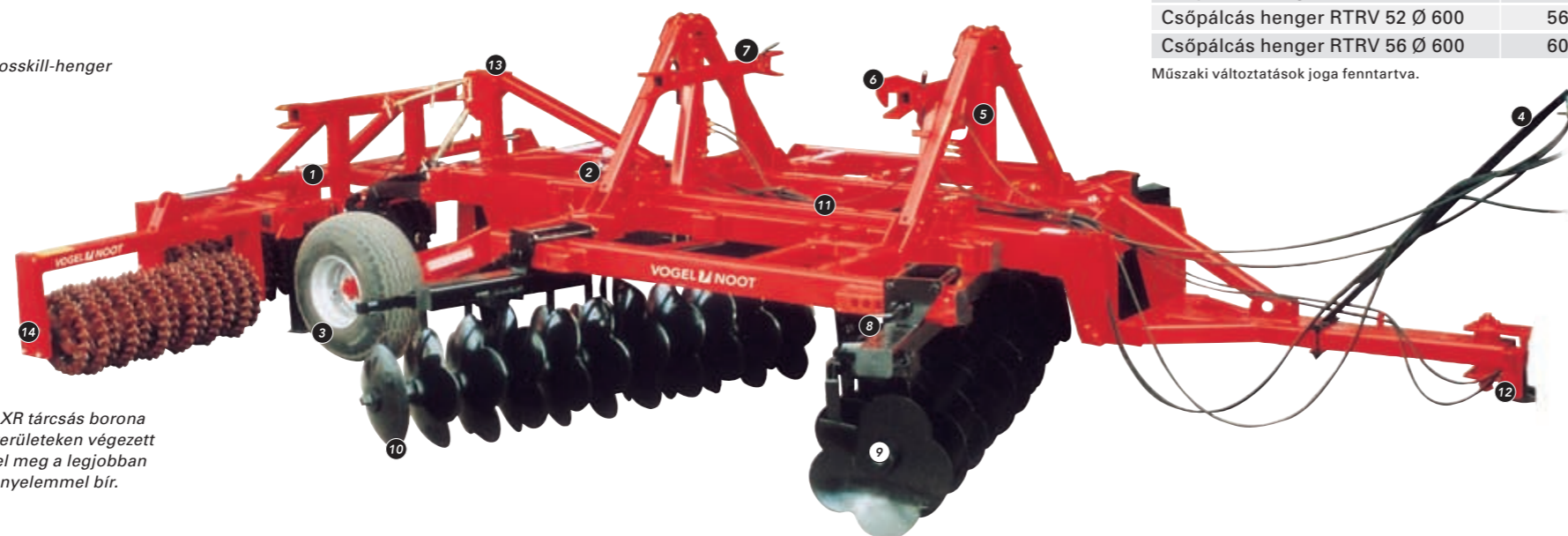
A VN MasterDisc AXR tárcsás borona különösen a nagy területeken végzett munkálatokhoz felel meg a legjobban és nagy kezelési kényelemmel bír.