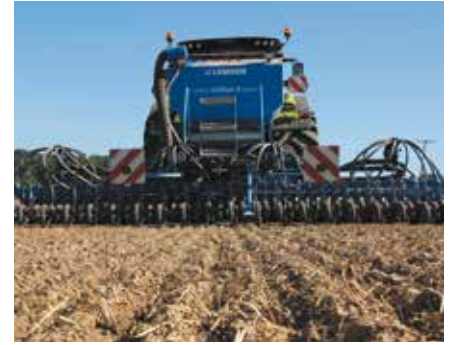
A külső elosztó

A magelosztók a tartályon kívül, közvetlenül a vetőegység fölött vannak elhelyezve.