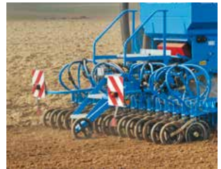
A jeladó kerék

A jeladó kerék kizárólag a megtett távolság mérésére szolgál. A csúszásmentes forgás biztosított, mivel nem kell meghajtó erőt átvinnie a vetőtengelyre.