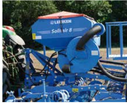
A hidraulikus meghajtású ventilátor

A ventilátor hidraulikus meghajtású. A ventilátor fordulatszáma fokozatmentesen állítható és független a TLT fordulatszámától.